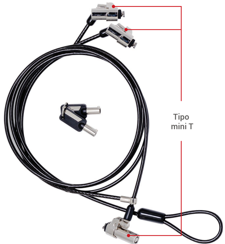
Tipo mini T